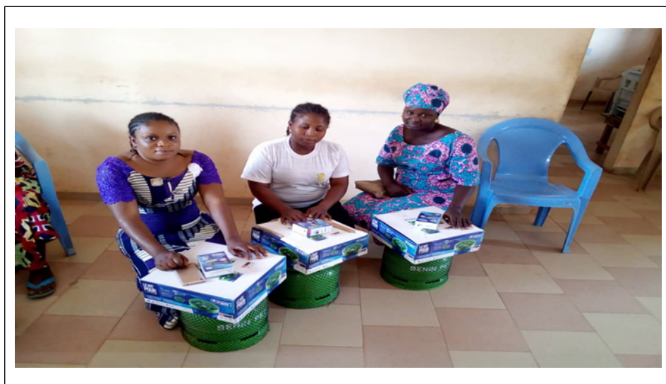
Photo12 : Remise de Kit de gaz aux bénéficiaires femmes