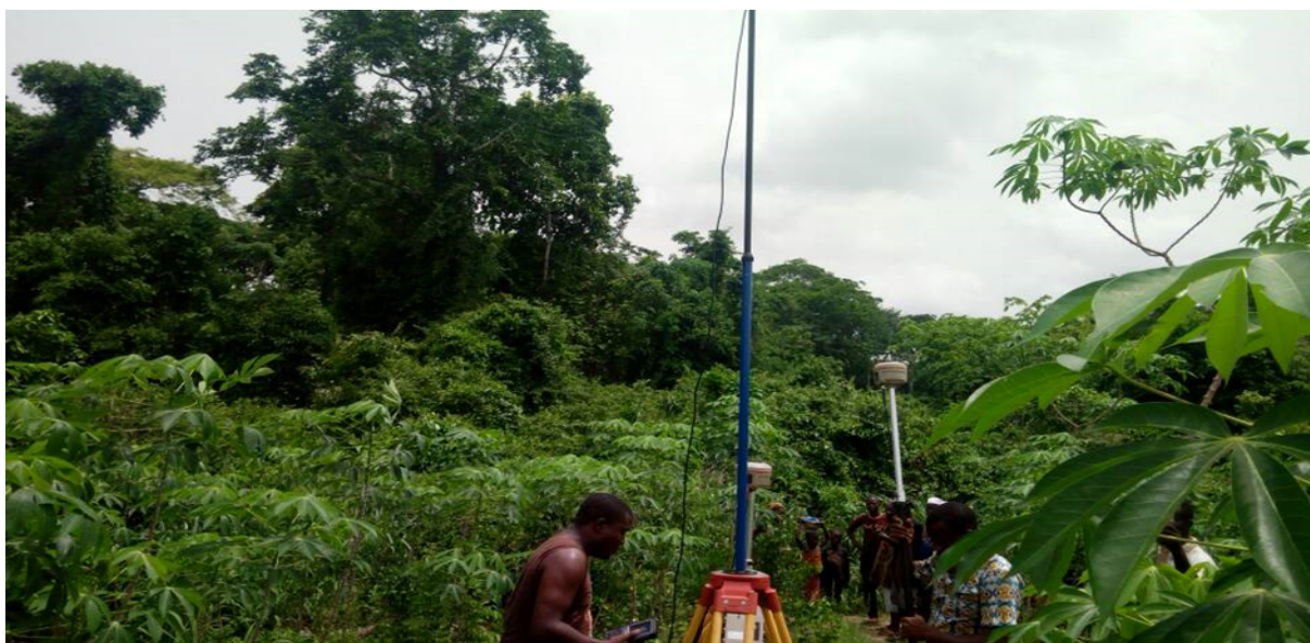
Photo 1 : Opération de délimitation et de réalisation du levé des FS (FS Gbèvozoun dans la Commune de Bonou)