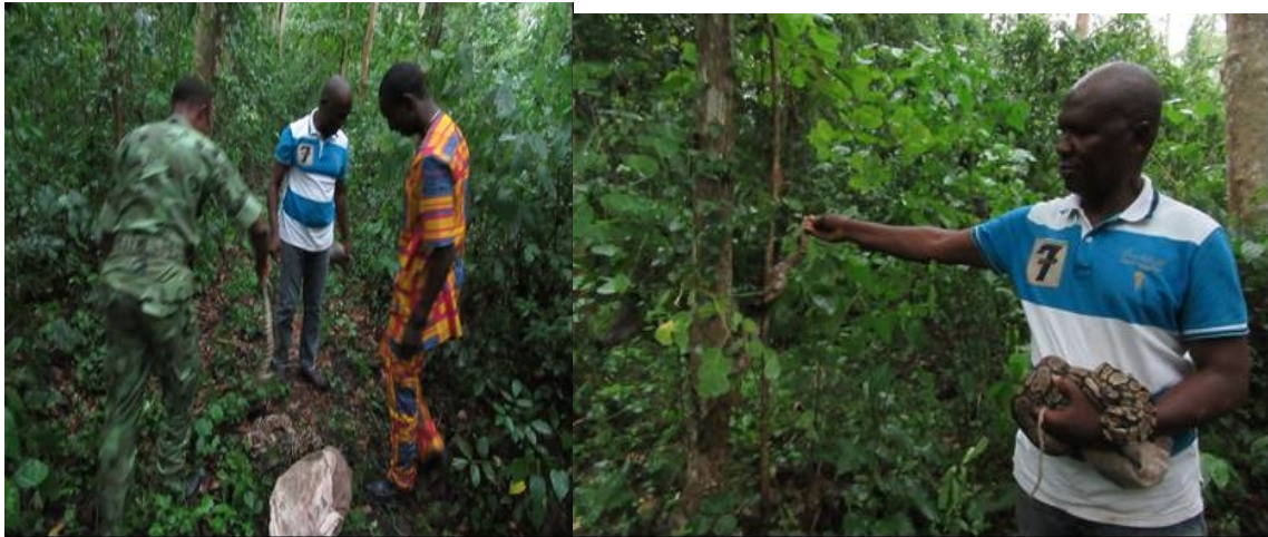
Photo 6: Représentant des éleveurs spécimens CITES en pleine séance de lâcher dans les FS