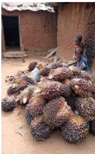
Photo 14 : Régimes de palme achetés pour fabrication d'huile rouge à vendre à SAKETE