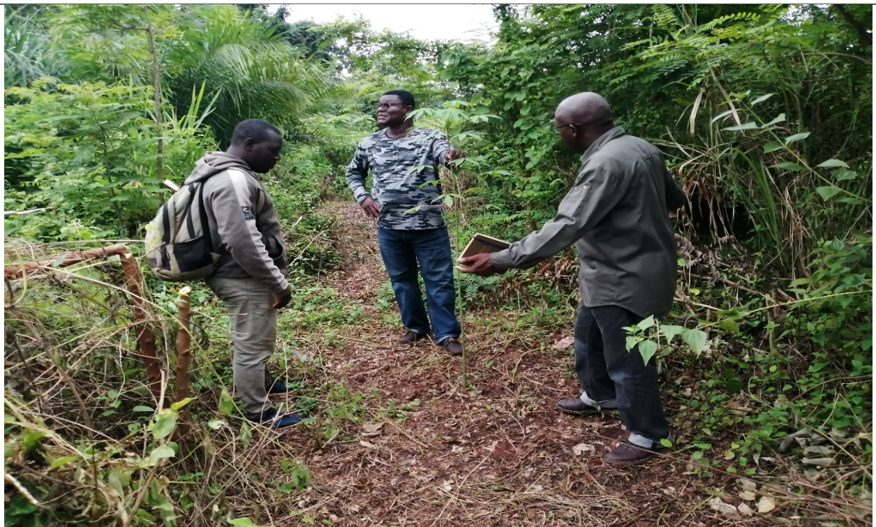
Photo 10 : Enrichissement de FS. Ici un plant de Ceiba Pentendra dans une trouée