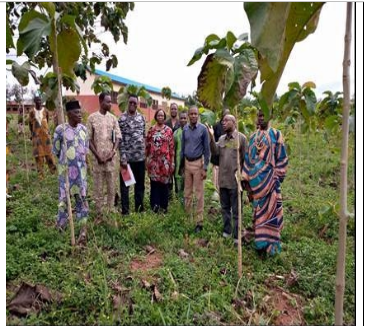
Photos 7 et 8 : Plantation de Tectona grandis d'un (01) an dans les terroirs