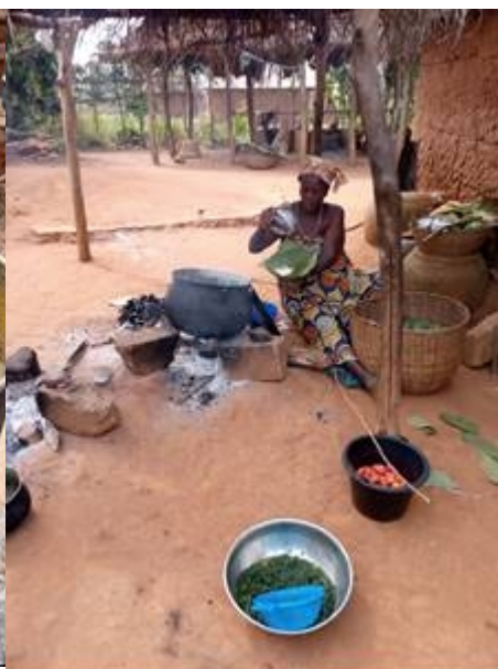
Photo 16 : Fabrication d'akassa (pâte de maïs fermentée) pour le petit commerce à Toffo