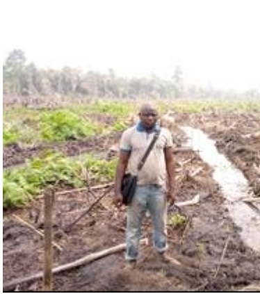
Photo 20 : Mise en place de système amélioré de production de riz à ZE