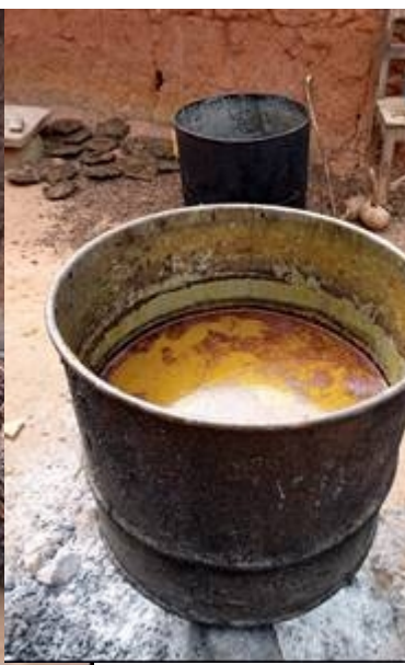
Photo 15 : Fabrication de l'huile rouge après transformation des régimes de palme à SAKETE